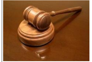
Realizzazione della mansarda, necessità del titolo edilizio