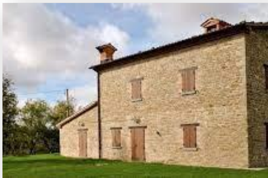
Immobili ante 1967, prova della data di realizzazione

Nel caso di specie il ricorrente aveva sostituito un vecchio manufatto con un manufatto in lamiera senza presentare alcuna pratica edilizia per la sostituzione e non essendo in possesso di atto autorizzativo del preesistente. Ritenuto il manufatto come "opera di nuova costruzione", il Comune ne ordinava la rimozione e la rimessione in pristino del terreno. Secondo l'appellante il manufatto era stato originariamente costruito in data anteriore al 1967 e quindi in epoca antecedente all'introduzione dell'obbligo del previo rilascio del titolo edilizio. Inoltre, i lavori in corso al tempo del sopralluogo comunale consistevano in una mera attività di ristrutturazione con sostituzione di elementi strutturali e mantenimento di sagoma, superficie e volumetria di quanto già esistente; pertanto, non erano inquadrabili come opere di nuova costruzione.